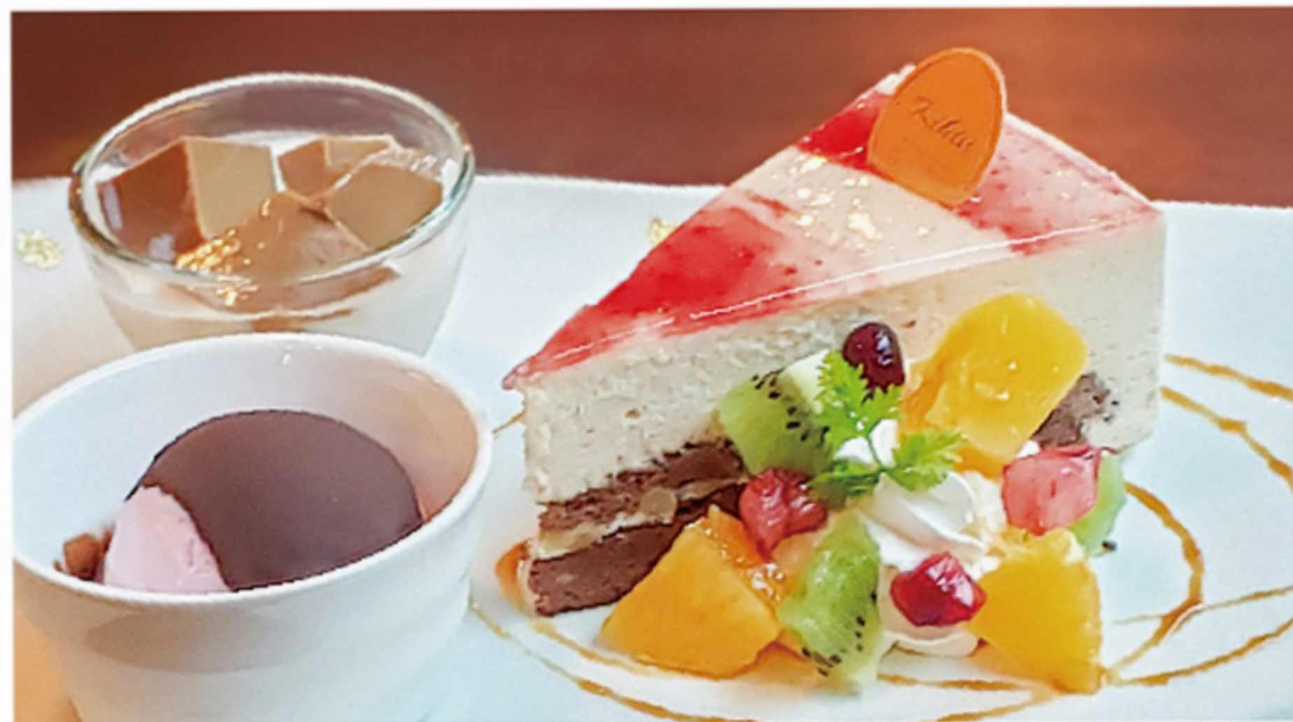
アールグレイ・ブラウニー