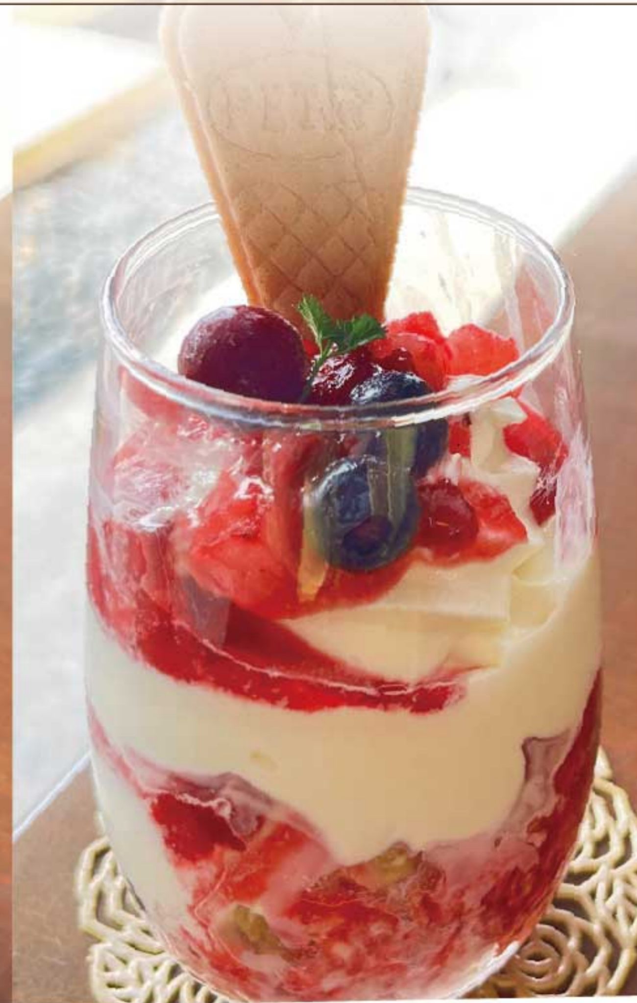
ベリーパルフェ 780円(税込)