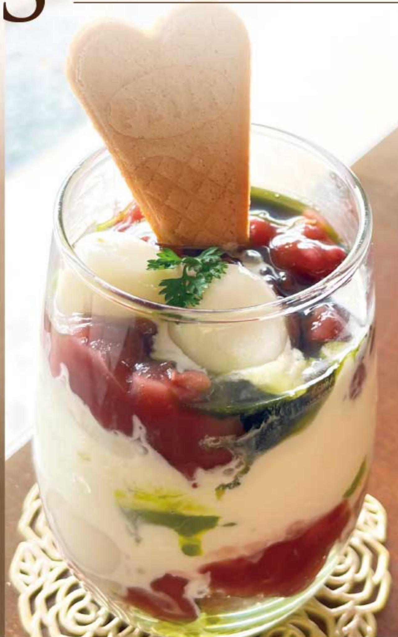
抹茶パルフェ 780円(税込)