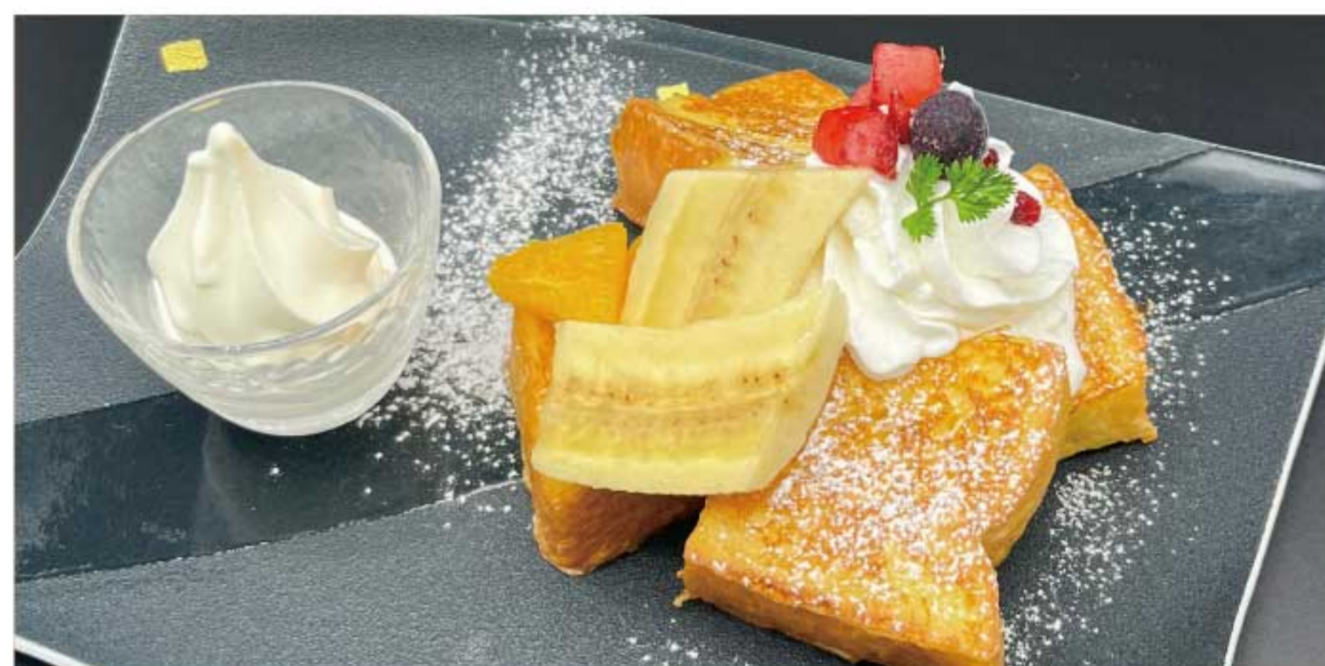
フレンチトースト 680円(税込)