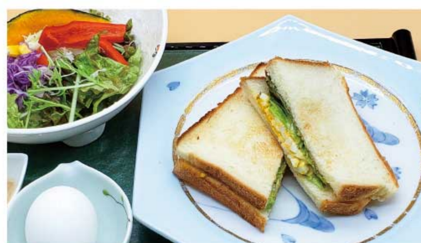
サンドイッチセット 900円(税込)