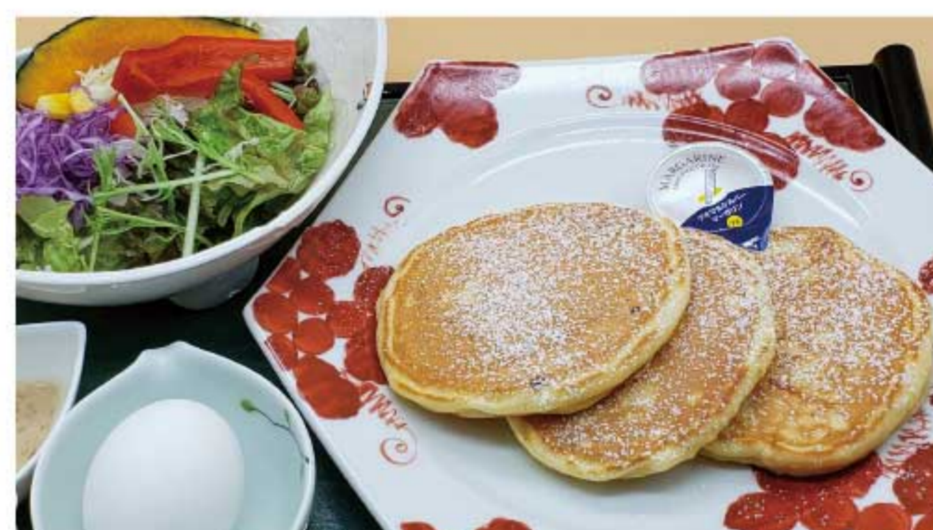
パンケーキセット 800円(税込)