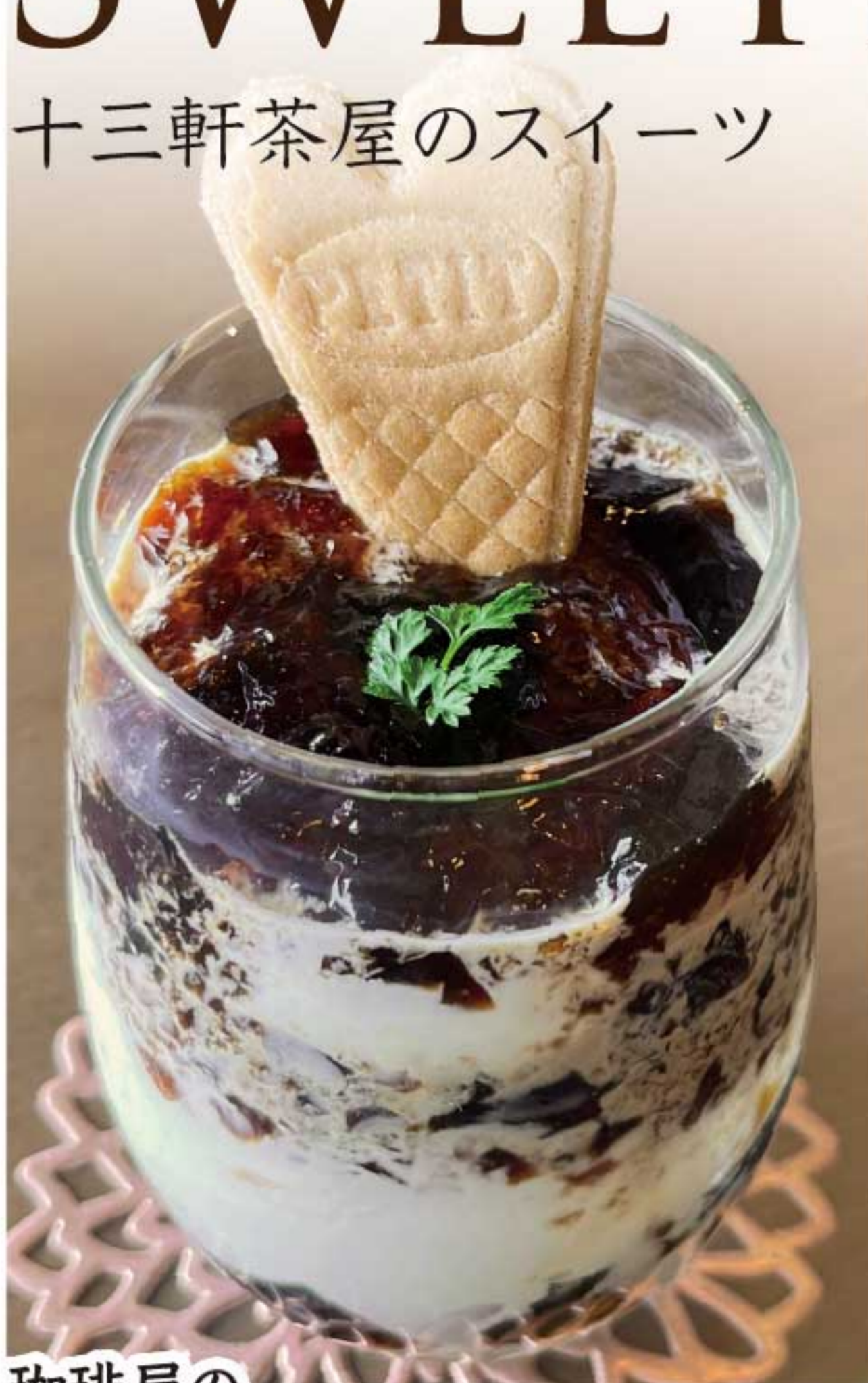
珈琲屋の コーヒーゼリーパルフェ 780円(税込)