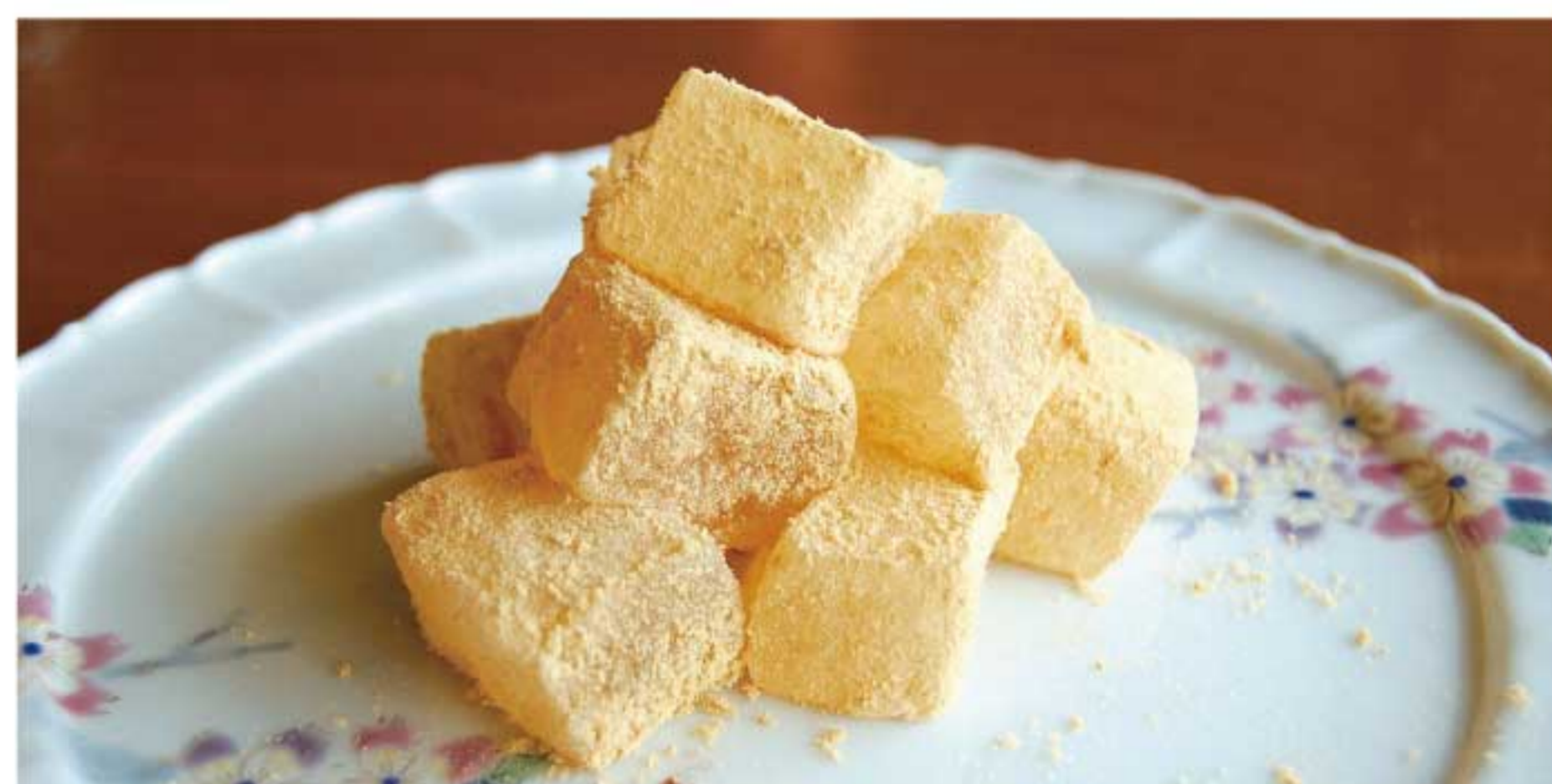
手作りわらびもち 580円(税込)