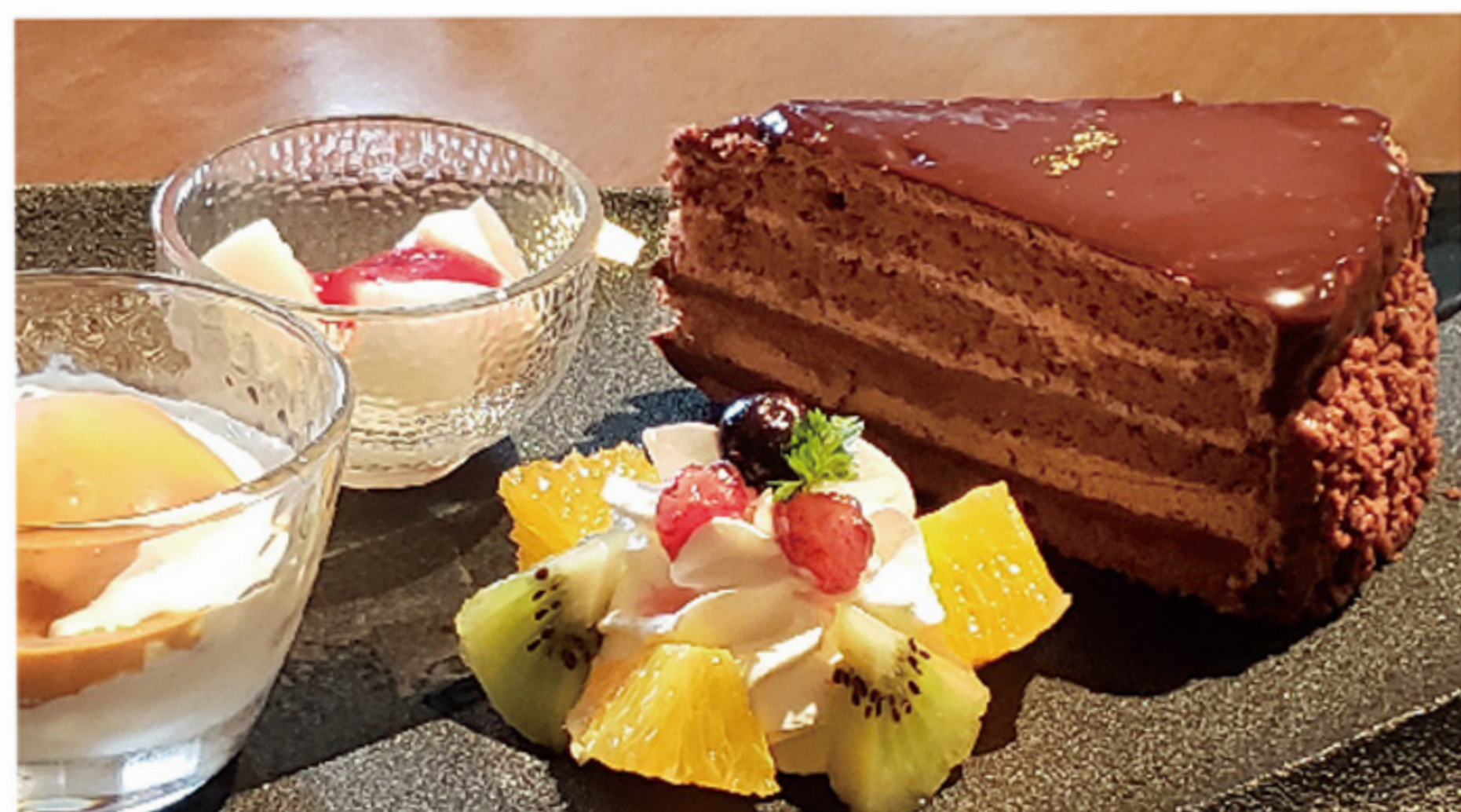
グラン・ショコラ