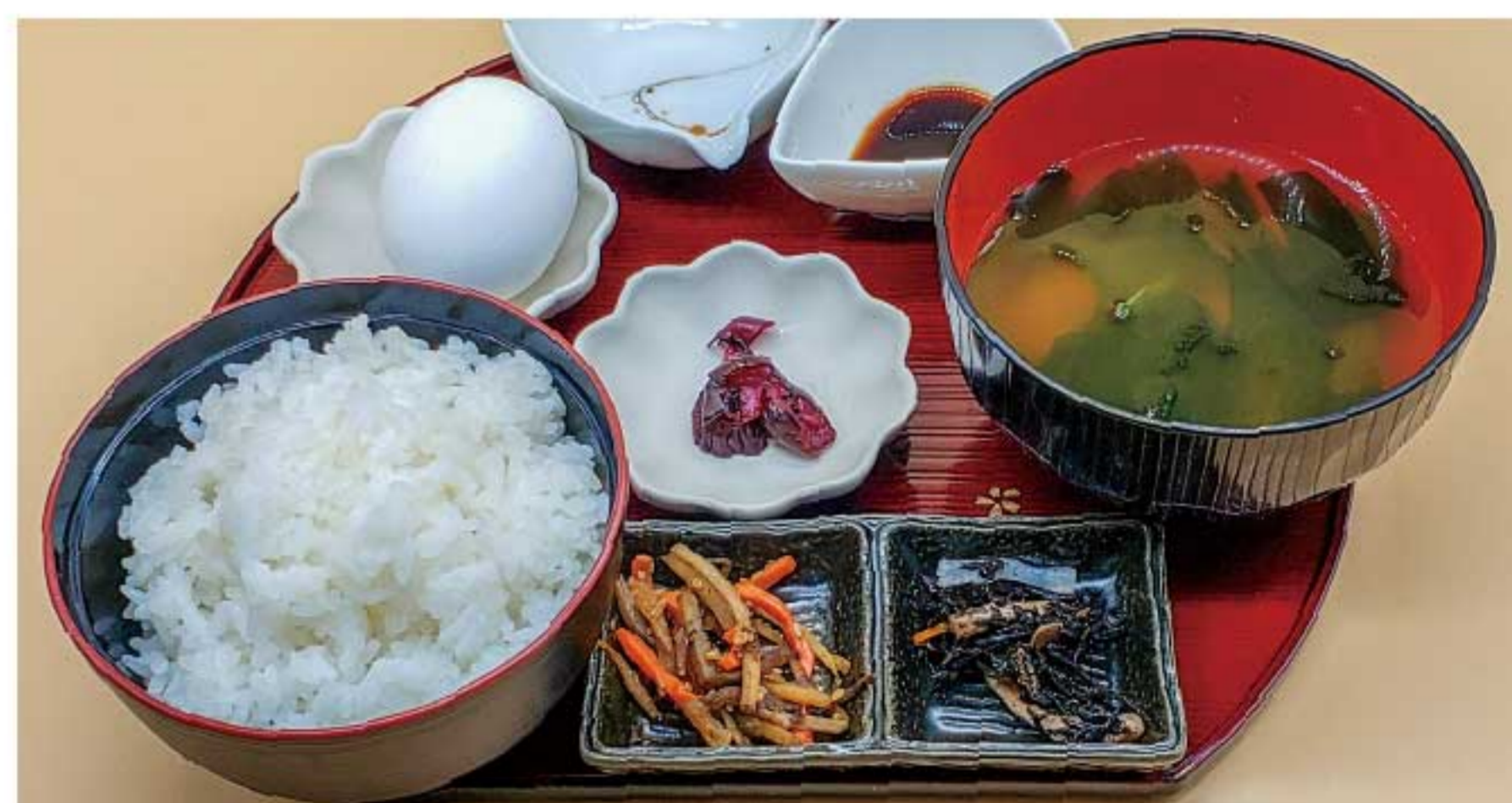
卵かけ定食セット 750円(税込)