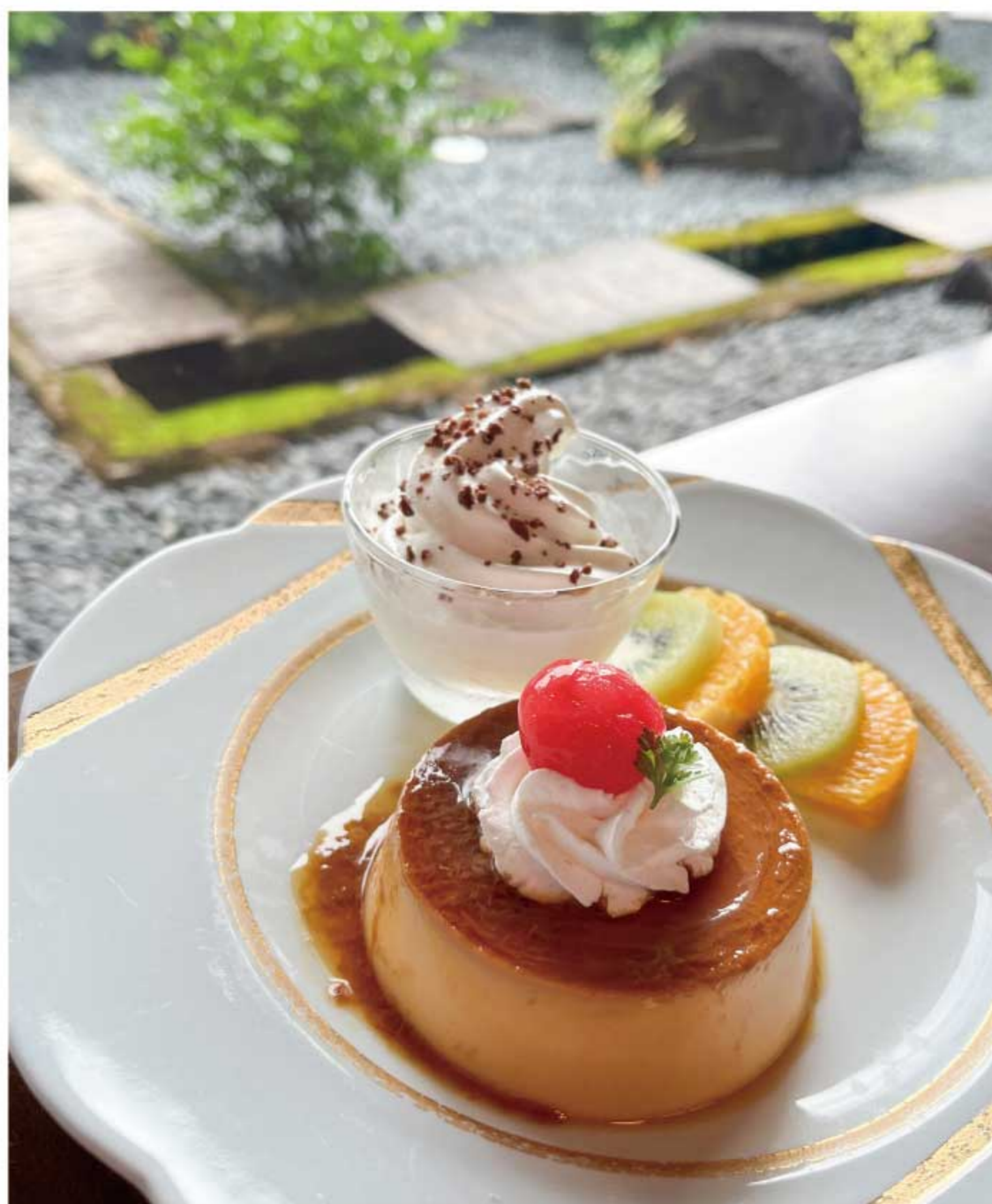
カスタードプディング 680円(税込)