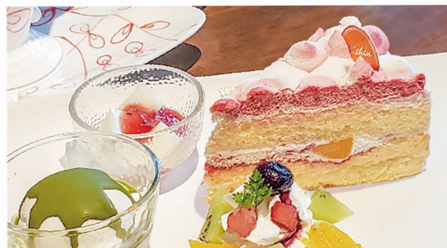
木苺のショートケーキ