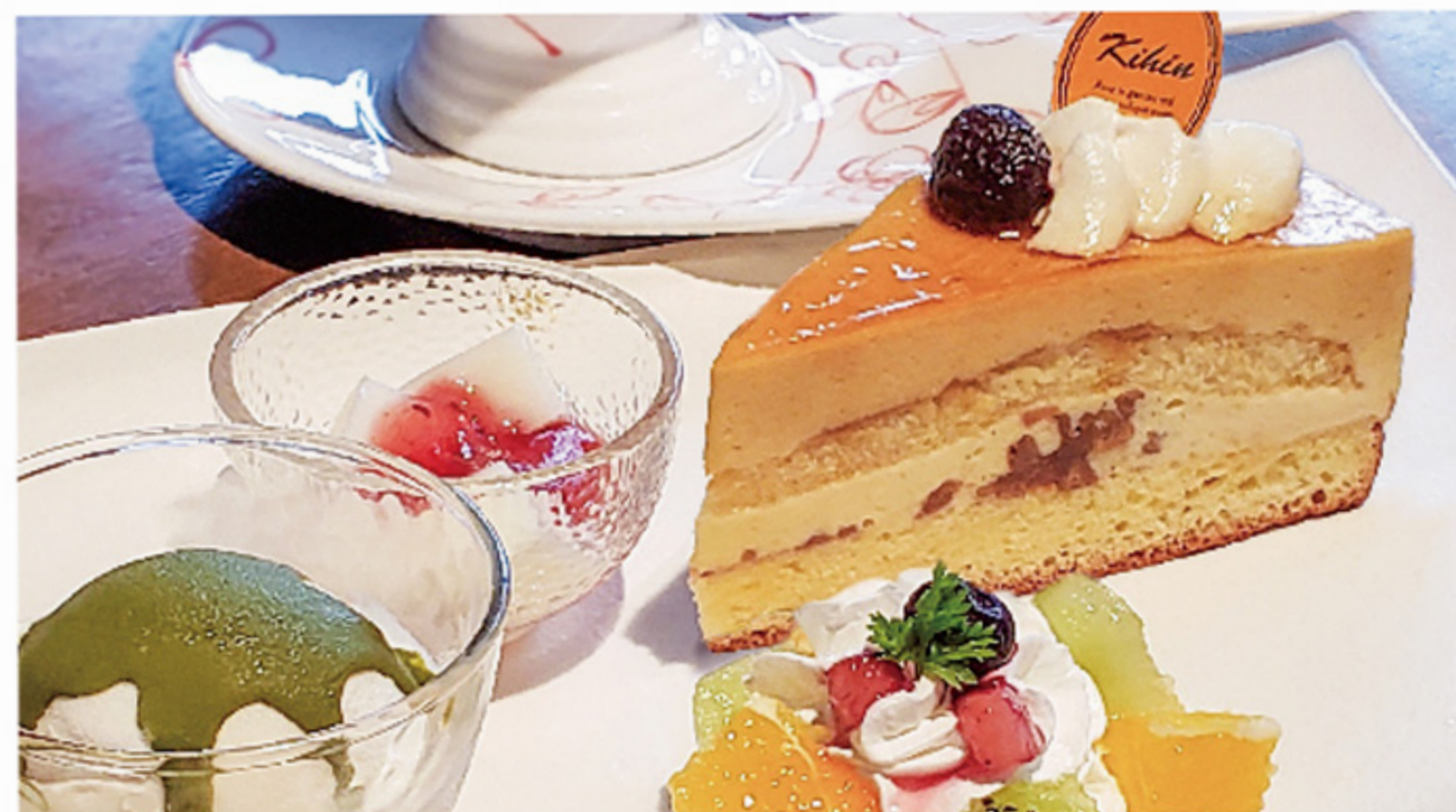
キャラメル・バニージュ