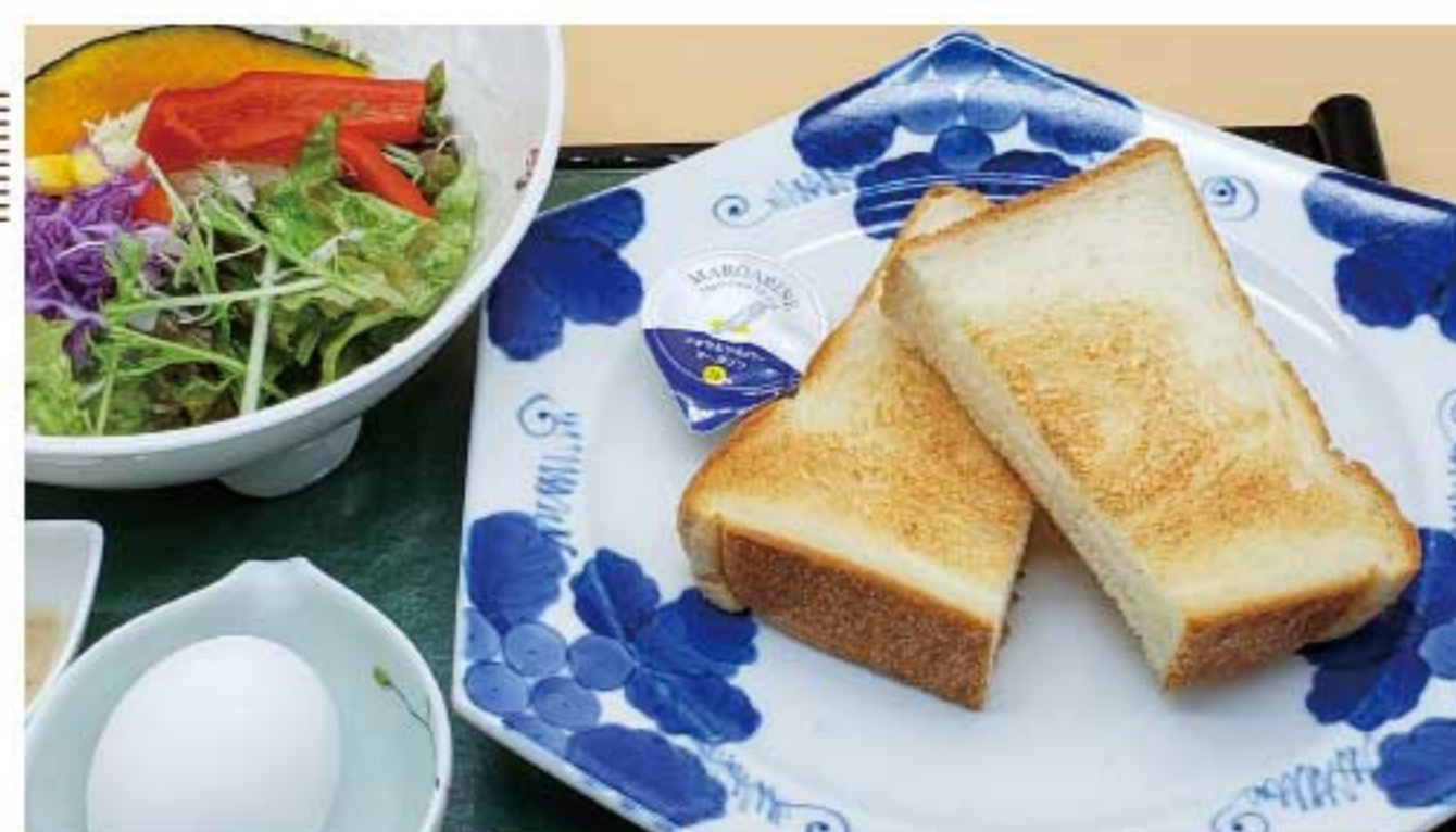
トーストセット 750円(税込)