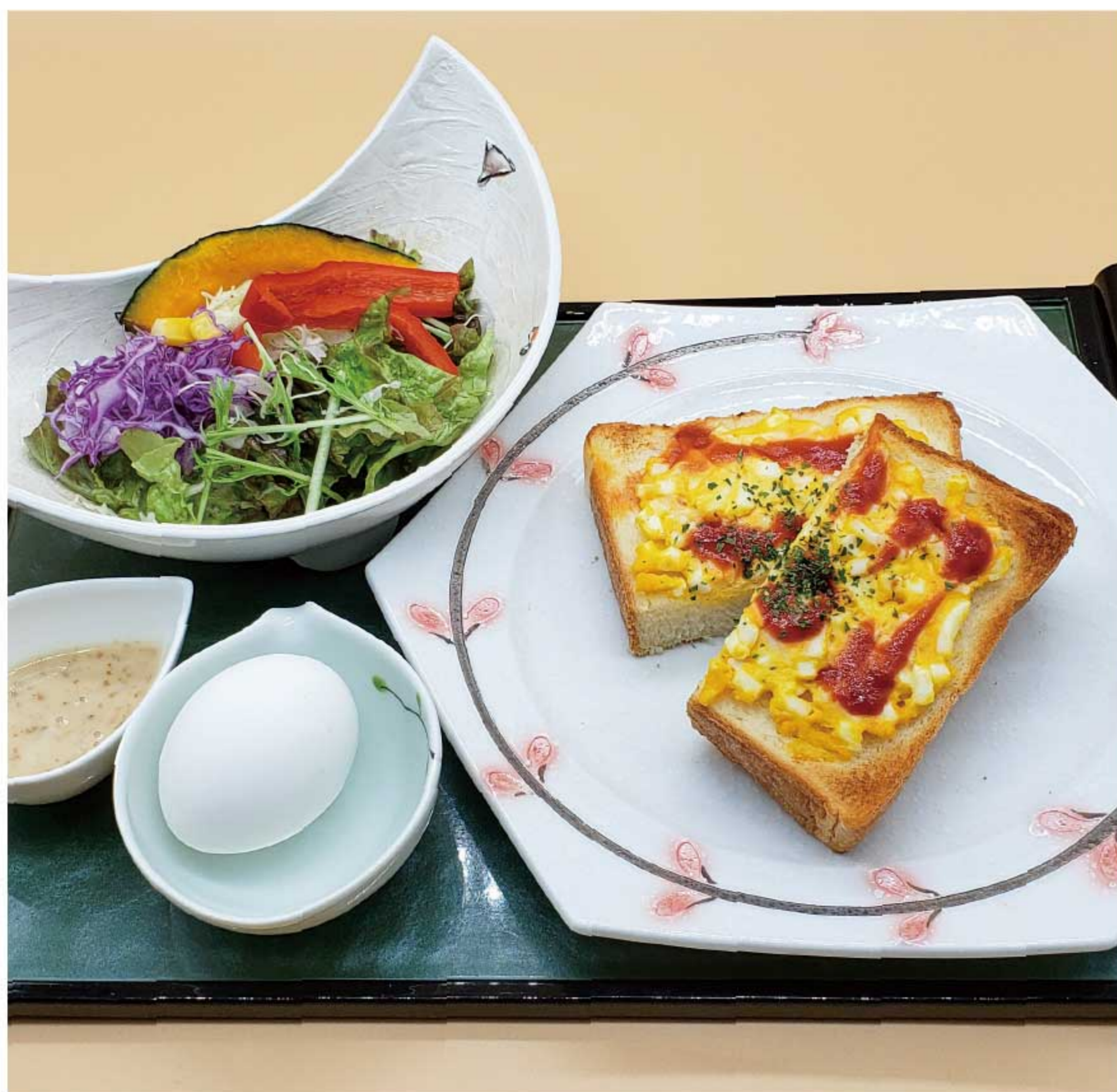
エッグトーストセット 800円(税込)